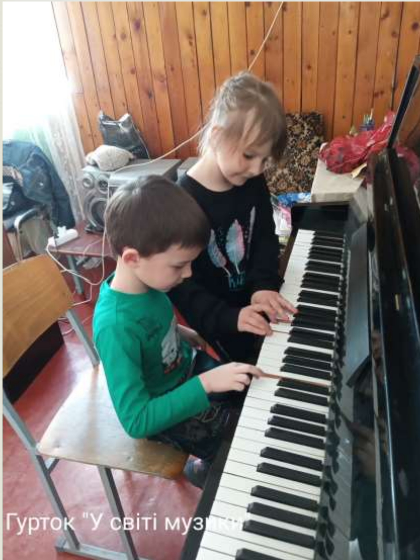
Гурток "У світі музики"